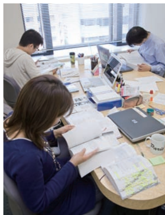
先生の国試解答をみんなで検証中。 自分が受けた国試だけに真剣デス