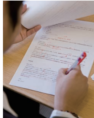
『QB』の解説原稿をチェック中。執筆者の専門医に学生視点から提案します

*毎年応募者多数のため、ご応募いただいても応募者全員を採用することができない場合がございます。予めご了承下さい。