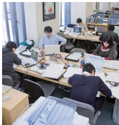
おしゃれな街（のはず）・青山でなぜか 地味〜に医学書制作です